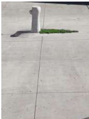
Ilya und Emilia Kabakov Drinking Fountain, 2003 Bahnhofplatz, Alpenstrasse 20 Stadt Zug, Schenkung: Wasserwerke Zug AG (2003)