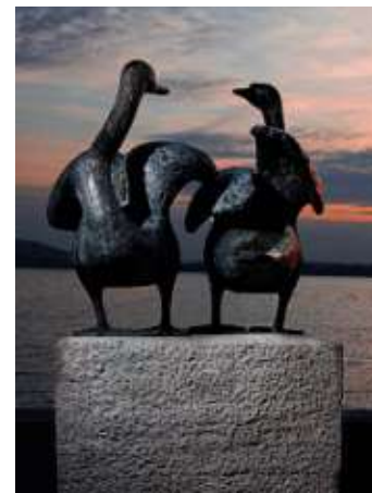
Romano Galizia Ohne Titel, 1960 Vorstadtquai Stadt Zug