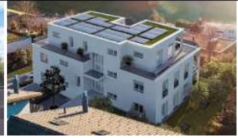
Neubau MFH Sonnenberg, Menzingen/ZG

Damit ein Bauprojekt erfolgreich umgesetzt werden kann, ist eine fachkompetente Planung und Bauleitung von Neu- und Umbauten mit hohen Ansprüchen an Qualität eine ganz wichtige Voraussetzung. Massgebend für gelungene Bauten, die lange Freude bereiten, ist zweifellos die richtige Wahl eines Planers und Bauleiters mit langjähriger Erfahrung. Denn nur Ästhetik gepaart mit Funktionalität ist der Schlüssel für eine erfolgreiche Zukunft!