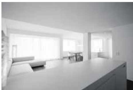
Umbau Wohnung Zug