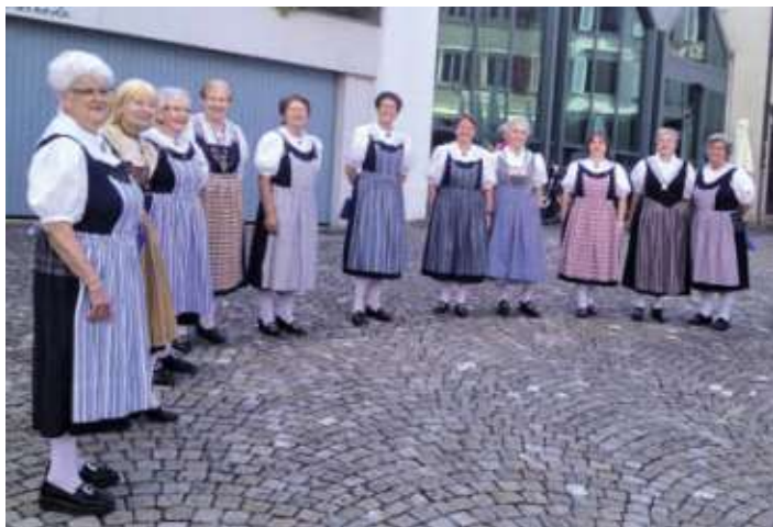
Spontaner Auftritt am Zuger Altstadtmarkt, Landsgemeindeplatz, 05.09.2020

Wir würden uns über neue Sängerinnen und Tänzer- und Tänzerinnen sehr freuen. Die Singgruppe probt am Montagabend, die Tanzgruppe am Dienstagabend.