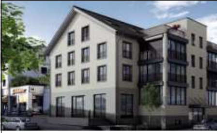
Ersatzneubau WGH Seestrasse, Unterägeri/ZG