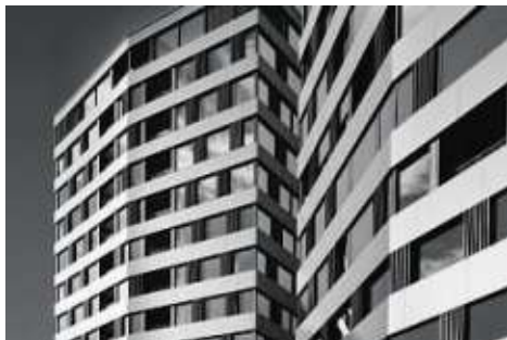
Neubau Hochhäuser One - One Cham