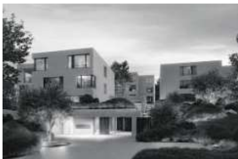
Neubau Arealbebauung Bohlgutsch Zug