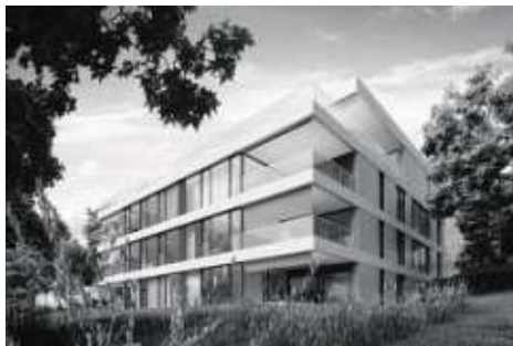
Neubau Mehrfamilienhaus Walchwil