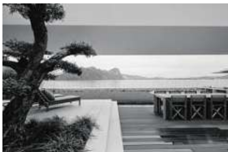
Neubau Residenz Seesicht Vitznau