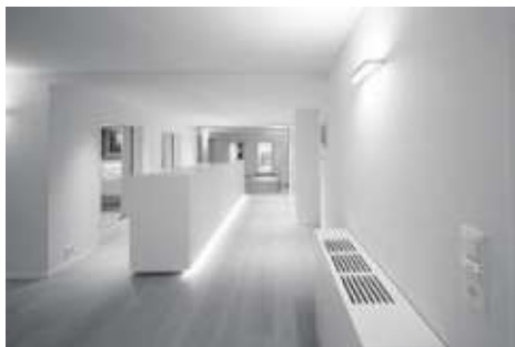
Umbau Büro Altstadt Zug