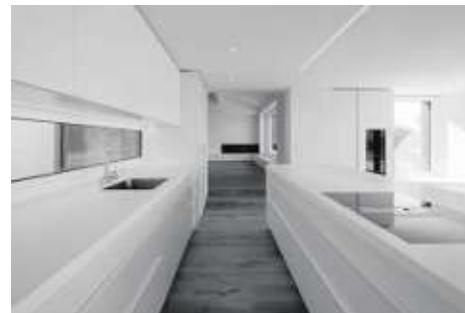
An- Umbau Einfamilienhaus Aeugst am Albis