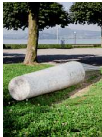
Flavio Paolucci L'ombra sul passato, 1991 Rigiplatz Stadt Zug