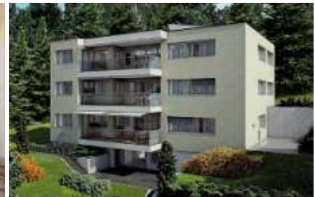
Neubau Wohnüberbauung Wasserschaft, Erstfeld/UR