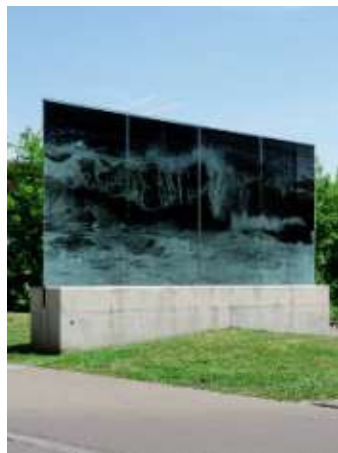
Balthasar Burkhard Welle, 1996 Verwaltungsgebäude Wasserwerke Zug AG, Chollerstrasse 24 Wasserwerke Zug