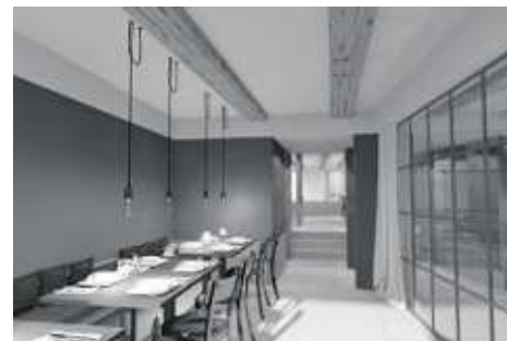
Umbau Haus Taube Altstadt Zug