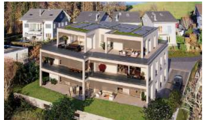
Neubau MFH Sonnenberg, Menzingen/ZG